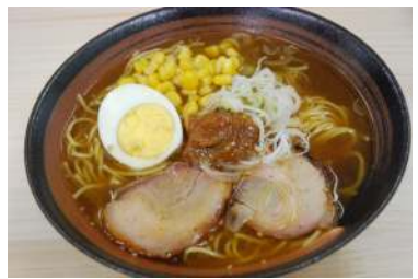
辛みそラーメン 680円