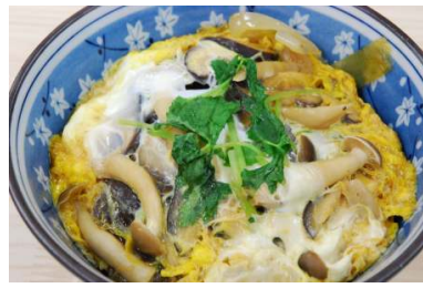
川根産しいたけ丼 600円

12月4日(金)より、食事も冬メニューに変わりました。 川根産椎茸を使用したメニューが新登場！！ 冬に食べたい辛みそ味が、ラーメン、そば、うどんになって登場です！！