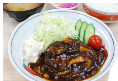
ハンバーグ定食 780円