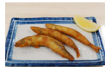
シシャモからあげ 200円