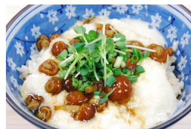
とろろなめこ丼 680円