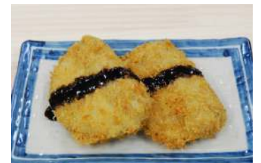
黒はんぺんフライ 250円